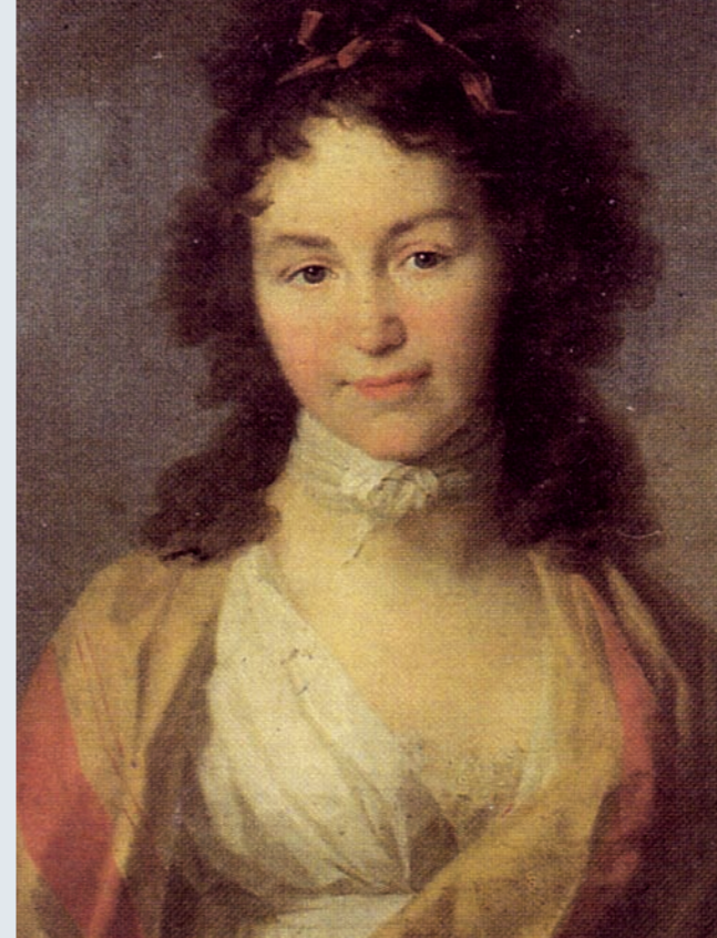
Porträt von Johann Friedrich August Tischbein (1750-1812)